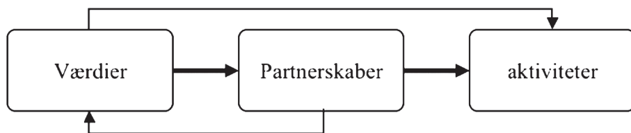
Figur 1: Værdiers indflydelse hos de internationale organisationer

Organisationernes værdier har således stor indflydelse på, hvilke partnerskaber de indgår i, men der foregår også en påvirkning den anden vej. Eksempelvis fortæller flere af medarbejderne i de internationale organisationer, at de lærer meget af deres etiopiske partnerorganisationer. Denne påvirkning er svagere end påvirkningen fra værdier til partnerskaber og derfor markeret med en almindelig pil i modellen. Det skyldes, at selvom partnerskaberne har indflydelse på værdierne, har de undersøgte organisationers værdier en fast kerne, som ikke påvirkes.