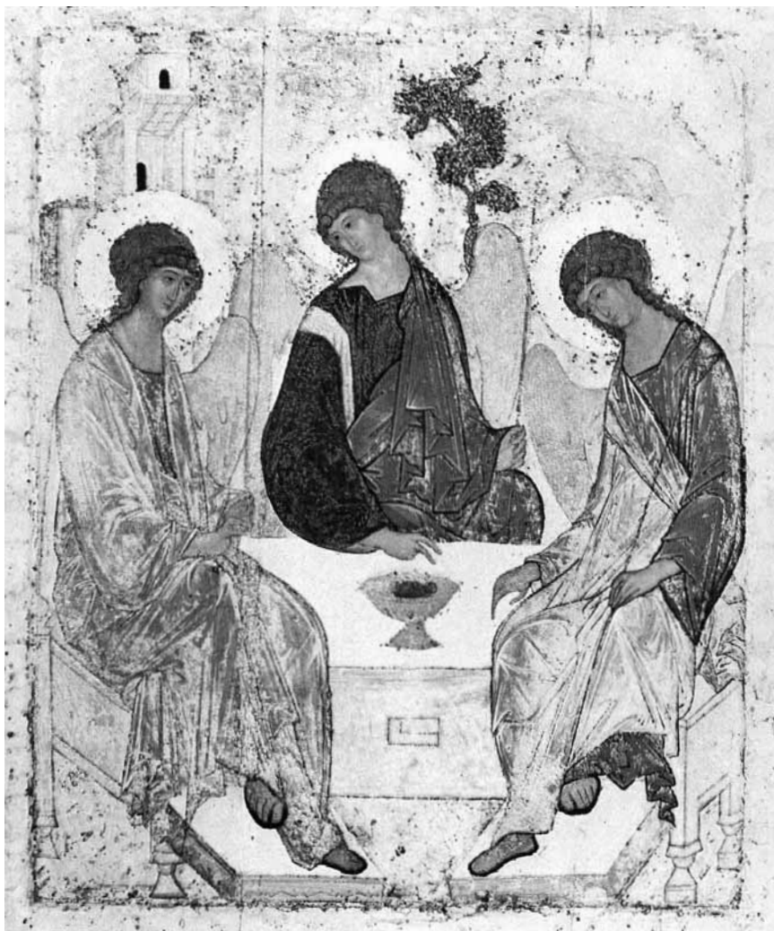
Andrej Rublev: Den hellige treenighed, 1411 (Moskva).

i Kristus, som derfor er placeret i midten. På den måde er ikonen et for- nemmt udtryk for, hvordan de tre personer i Gud har forskellige funktioner samtidig med, at Gud deler med sig selv i treenhedens fuldkommen- hed. Stærkere end Rublev gør det, kan det ikke siges, at Gud deler eksis- stens og væren såvel som relationer og fællesskab med sig selv i treenig- heden.